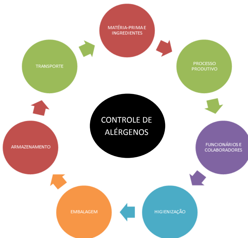
FIGURA 2. Aspectos relevantes para o controle de alérgenos.

Eventualmente, medidas suplementares deverão ser implementadas com o enfoque específico de evitar que os alimentos produzidos apresentem substâncias alergênicas advindas de contaminação cruzada. No intuito de apoiar o processo de identificação das etapas críticas e medidas de controle que devem ser implementadas pela empresa, estão apresentados a seguir aspectos relevantes que devem ser abordados no controle de alérgenos.